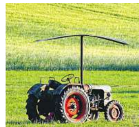
Feldhubschrauber (Th. Neumaier)