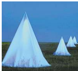
Love Motel für Insects (B. Ballangée)