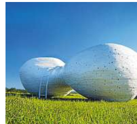
Wolkenliege (Toni Schaller)