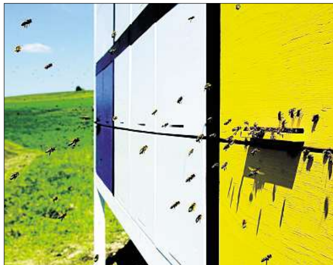
Bienen lieben die Konkrete Kunst. Totalkünstler Timm Ulrichs führt den Beweis mit der „Hommage an Mondrian“ und zeigt damit auch lebendige Flugobjekte.

Die Ausstellung „Flugobjekte“ auf dem alten Weinberg linkerhand kurz hinter Eining ist bei freiem Eintritt rund um die Uhr zugänglich. Am Wochenende ist die „Flugtonne“ als Anlaufstelle für Fragen und Informationsmaterial besetzt. Hier ist auch Treffpunkt für die naturkundliche Führung „Herbstflug – pflanzliche Flugobjekte – fliegende Pflanzen(teile)“ mit Michael Littel am 10. Oktober um 14 Uhr und die Kunstführung mit Gabriele Scholz am 24. Oktober um 15 Uhr. Am 29. Oktober findet eine offizielle Fimessage mit Thomas Neumaier's bebildertem „Streifzug durch die Kunstgeschichte“ zum Thema Flugobjekte statt, der Vortrag im Neustädter Rathaus beginnt um 19 Uhr. Die Ausstellung endet am 31. Oktober. DK